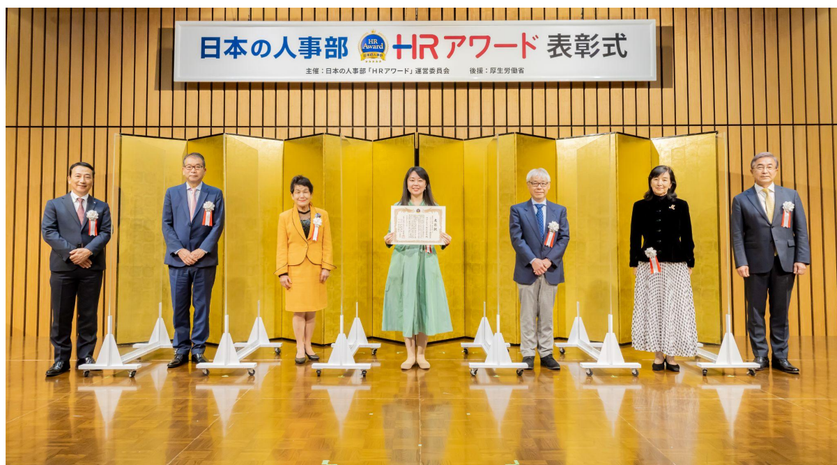
10月13日（水）赤坂インターシティコンファレンスにて開催された表彰式

また受賞記念として、これまでの1on1に関するAIによる分析データ共有を企画。11月25日（金）に第1弾としてウェビナーを開催し、AIデータ分析の活用による人事DX施策の可能性について共有します。