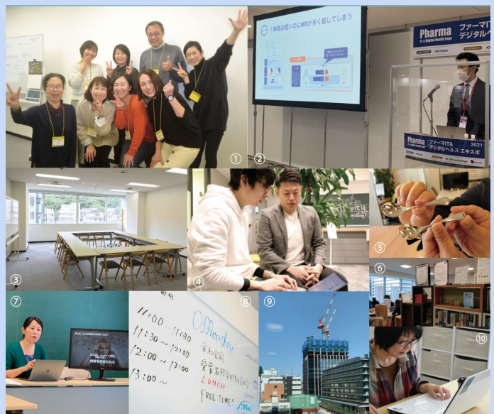
①徳島オフィスでのひとコマ、カメラを向けたときの笑顔 ②2021年4月に登壇した「ファーマIT」、多くの引き合いをいただきました ③窓から眉山(びざん)の緑が見える徳島オフィス ④大崎オフィスにて、1on1の真剣な打合せ!? ⑤勤続5周年記念に贈られた銀のスプーン ⑥大崎オフィスの様子 ⑦ウェビナー登壇が激増 ⑧リアルオフィスのプロジェクトも活発 ⑨大崎オフィスの社寮から ⑩地域を問わずどこからでも働けるありがたみを感じつつ、お仕事中心!